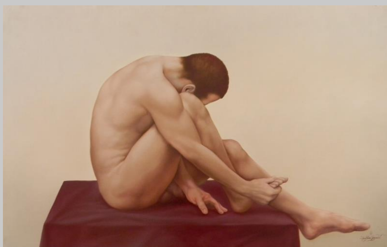
© Raúl García Sangrador, Ensayo anatómico (2009), óleo sobre tela, 100 x 150 cm

Proyecto de investigación “Memorias de las masculinidades disidentes en España e Hispanoamérica” (PID2019-106083GB-I00)